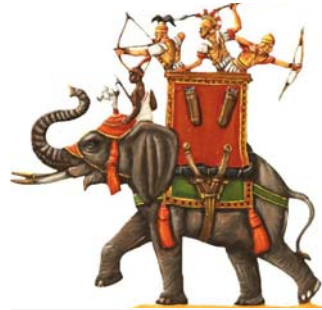
Elefant im Kampf

So steht in der Bibel: „Den Elefanten hielt man den Saft von Trauben und Maulbeeren vor, um sie zum Kampf zu reizen. Zu jedem Elefanten stellten sich tausend Mann; diese hatten Kettenpanzer an und bronzene Helme. Jedes Tier trug einen befestigten, gut gesicherten Turm aus Holz, dazu vier Soldaten, die von dem Turm aus kämpften, sowie seinen indischen Lenker.“